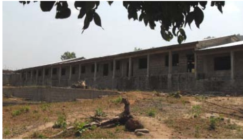
GRAFTON: DAK OP GEBOUW

wat erg belangrijk is zowel voor het programma zelf als voor de tuinen die we aan hopen te leggen.