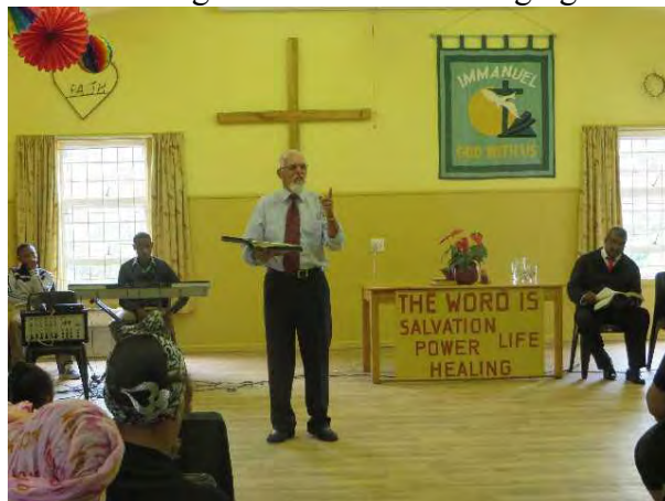
Carly bidt voor bevrijding