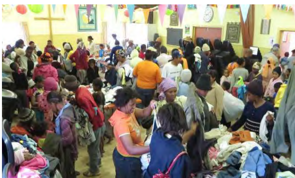
Ook weer een Kledingmarkt gehouden

We mochten nooit een foto van dit werk maken, maar we hadden nu toch toestemming gekregen dat één van de bewakers een paar foto's van ons en de gevangenen zou nemen als de gevangenen hun gezichten niet zichtbaar waren. We geven ze praktische Bijbellessen zodat ze die, als ze terug zijn in de maatschappij, kunnen gaan toepassen in hun eigen leven. We moeten ze echt soms nog heel veel normen en waarden leren. Wat voor ons gewoon en normaal is, hebben zij soms nog nooit aan gedacht. Ze schrijven alles op, zodat ze het nadien in de cel met elkaar kunnen bespreken als ze dat willen. Het is een heel hard leven hier in de gevangenis . Je moet sterk in je schoenen staan om ervoor uit te komen tegen de gangleden dat je voor Jezus gekozen hebt. Bid voor deze mannen.