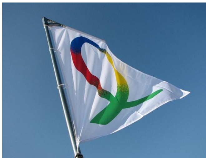
De ICHTUS vlag is van verre zichtbaar

Deze jongeman heeft gebed nodig, opdat hij de liefde van de Heer mag gaan ervaren en zijn hart zich voor Hem mag openen.