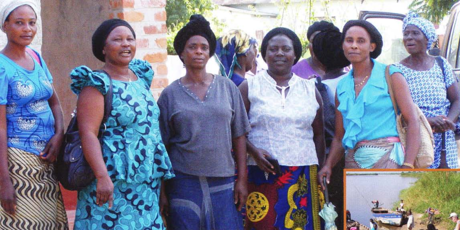
De Zambezi-rivier oversteken. >

naar Johannesburg, waar we overnachten. De volgende ochtend gaan we verder naar Mozambique.