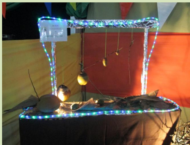
de blikvanger in de stand 'GROEI-PROCES'

In de eerste week van Maart is Paramaribo de plaats van handeling. Daar verwachten we wel een kleine duizend kinderen in de stand. Genoeg reden om u te vragen te bidden voor die week. In de daaropvolgende maanden staan er nog twee evenementen gepland, één in het district Marowijne en één in het district Para.